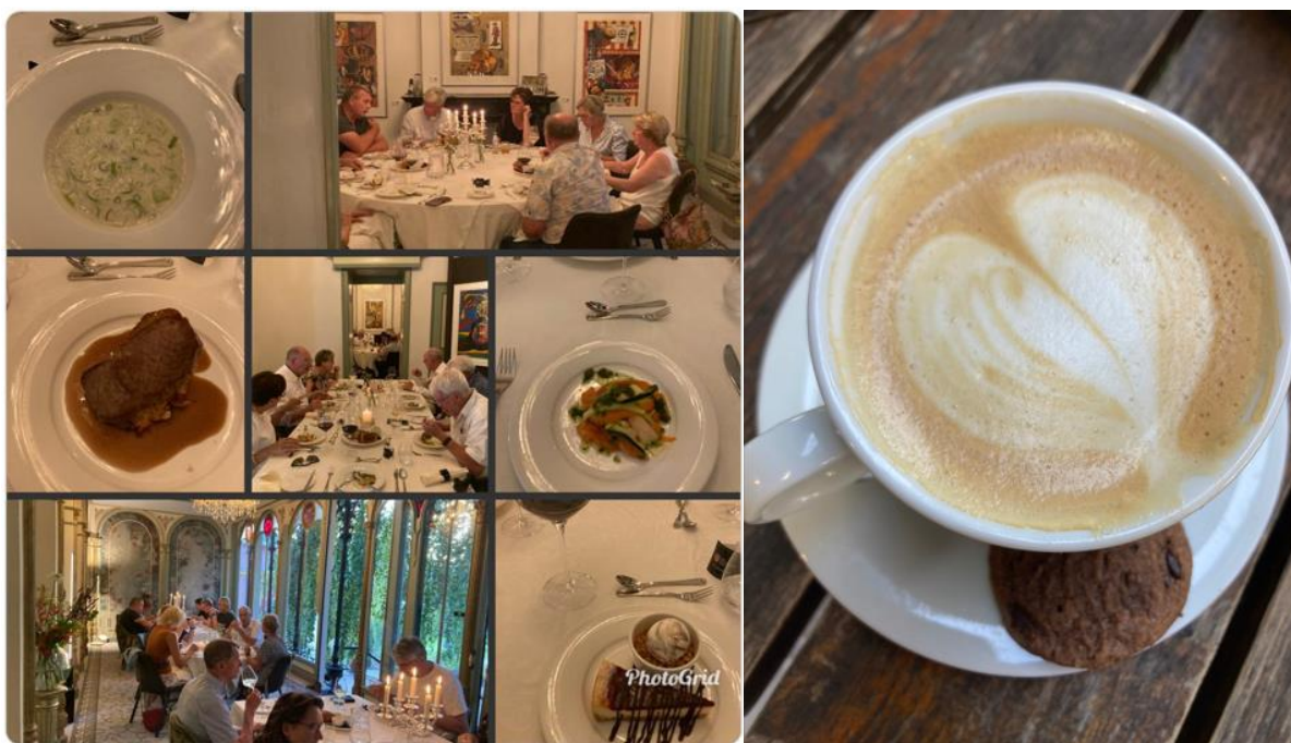
Een impressie van ons jaaruitje