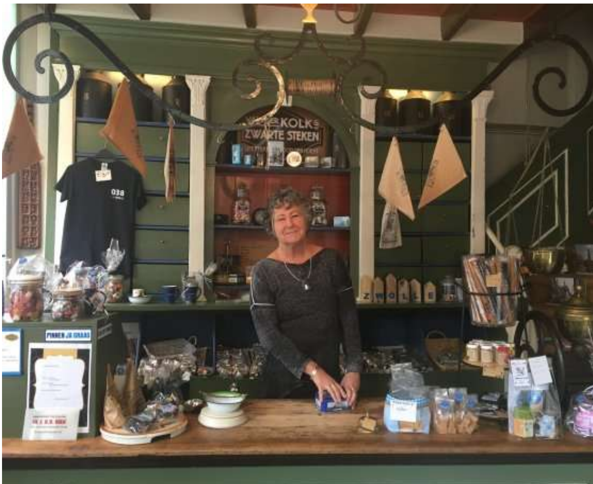
Het Zwolse Balletjeshuis

Daarna neemt de gids u mee op ontdekkingsstocht door de binnenstad. Tijdens de historische stadswandeling verhaalt de stadsgids over de geschiedenis van de Hanzestad en u bezoekt daarbij plekken en gebouwen waar u de geur van het verleden kunt opsnuiven. De wandeltour voert o.a. langs de Onze Lieve Vrouwe Basiliek met Peperbustoren en de enige nog overgebleven stadspoort van Zwolle, de ruim 600 jaar oude Sassenpoort waar tijdens de Middeleeuwen nog pek naar beneden kwam.. Tevens kunt u een groot aantal monumenten als de Schepenzaal en de Grote- of St. Michaëlskerk van binnen bezichtigen (indien beschikbaar). De geschiedenis ligt op straat, je moet er alleen oog voor hebben!