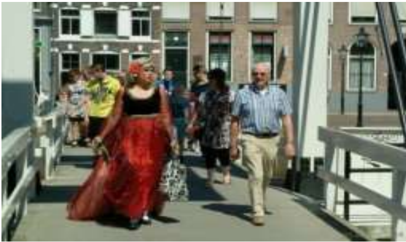
De meisjes van plezier