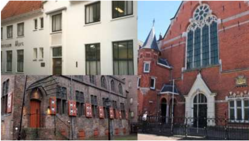
Wandeling door Joods Zwolle