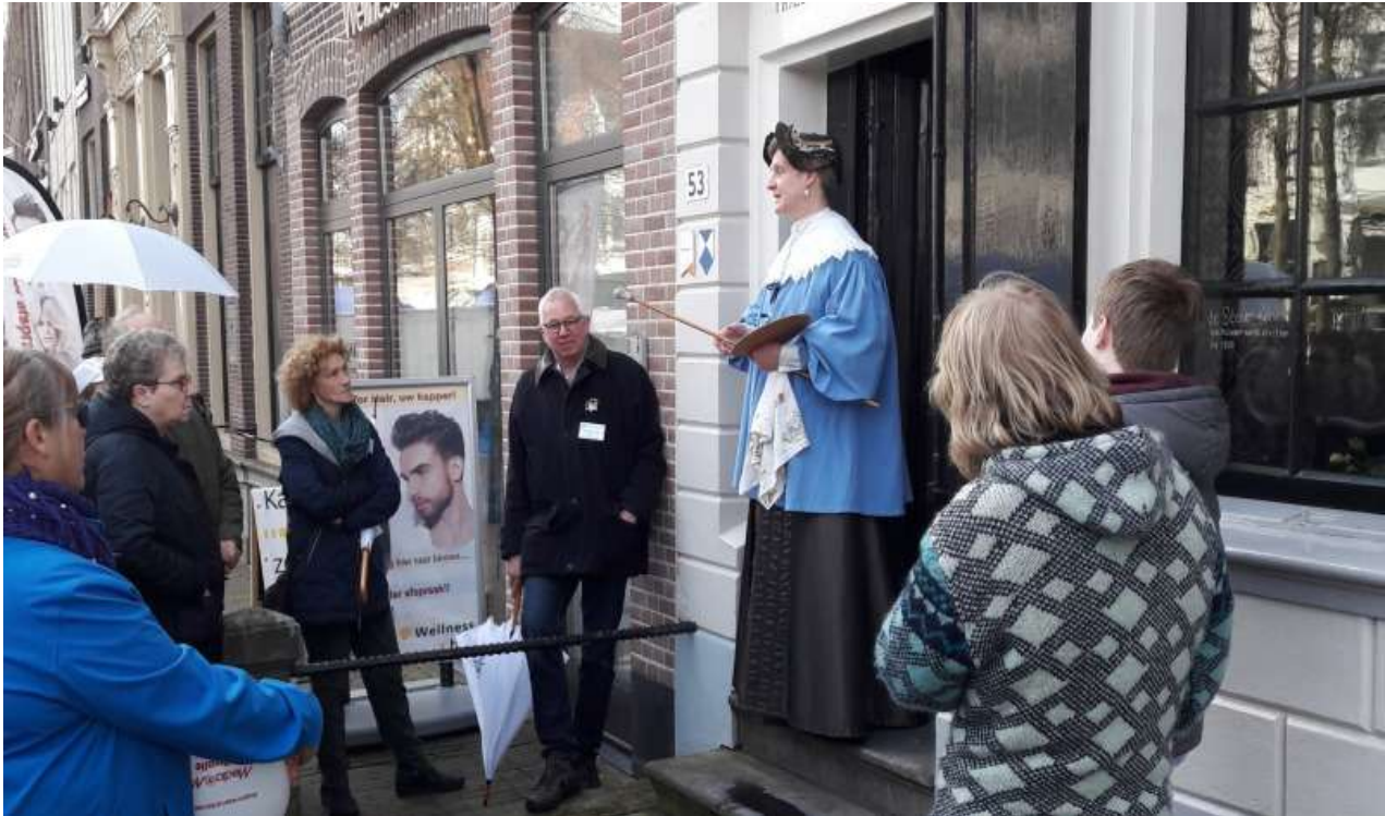
Hofjes in Zwolle (vrouwenhuis)