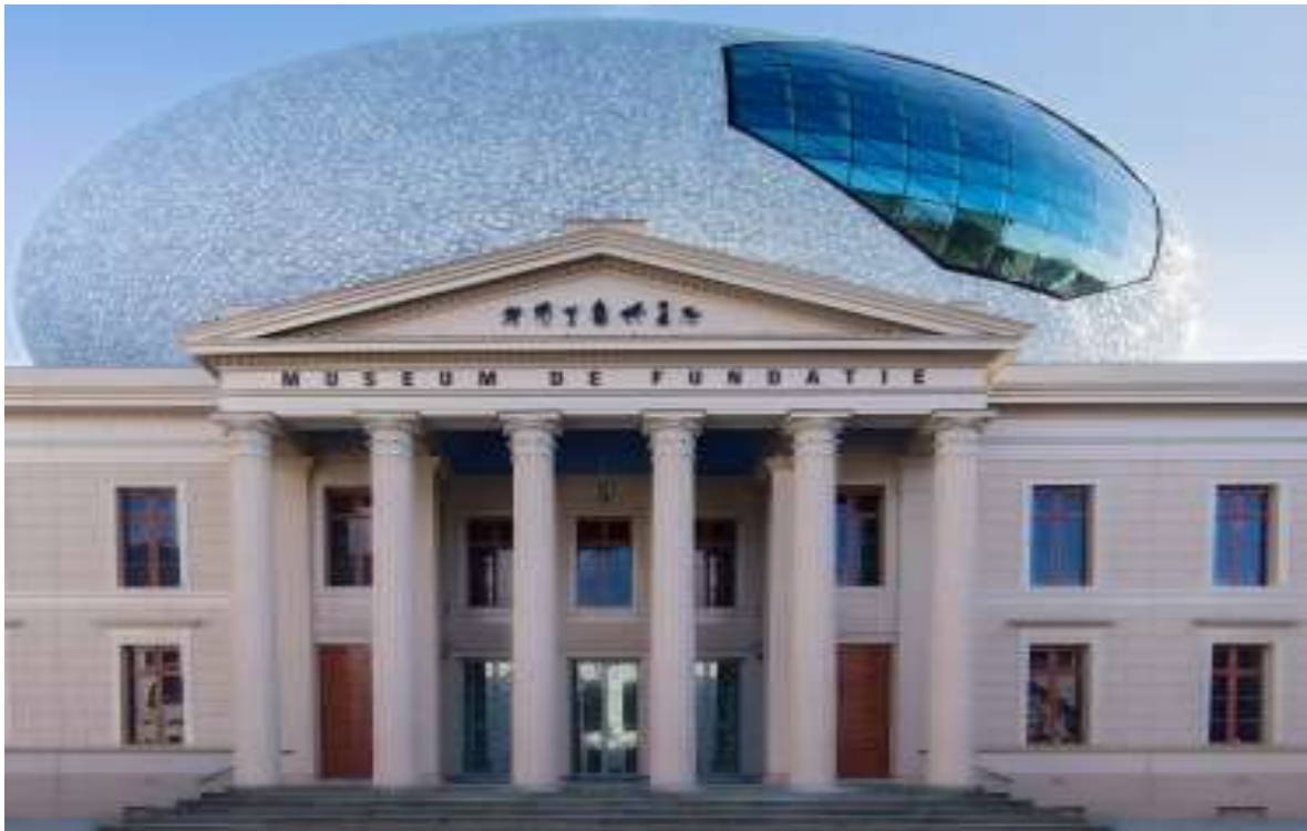
Museum de Fundati