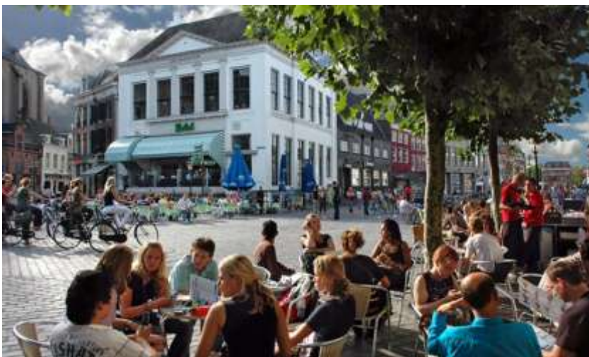
Terras op de Grote Markt