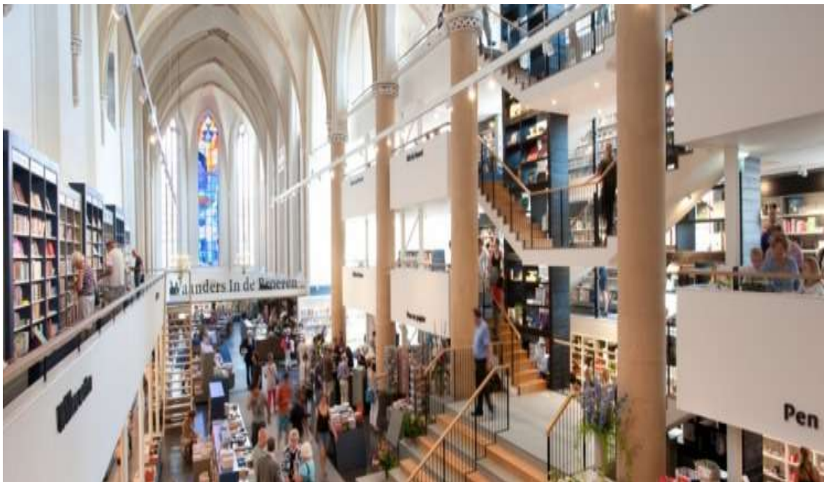
Waanders in de Broeren