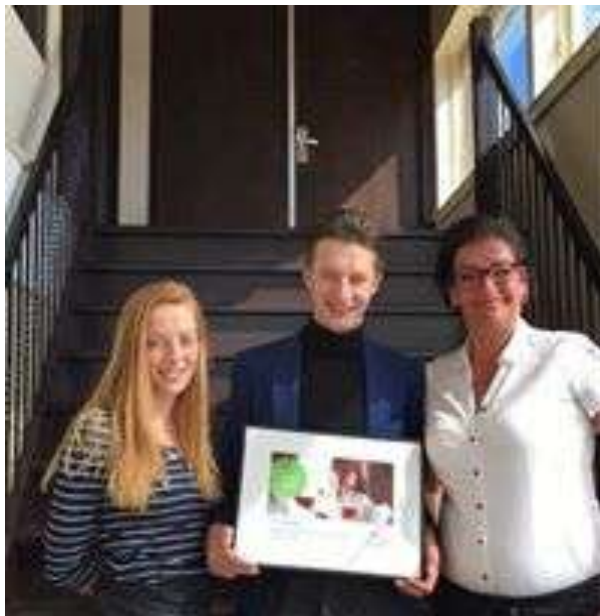
Genieten bij de Jufferen Lunsingh